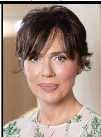
Autor: Dušan Grubešić

PRELJINA PRIRAST PRIVOLA PRZNICA RADIJAN RAVENTA RAZMERA RILIČAR SALVETA